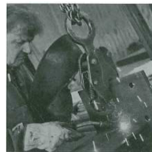
Bild 1. Altmodischer Zusammenbau von Stahlträgern

Sehr gut automatisiert ist üblicherweise der Zuschnitt. Da dort an den einzelnen Anlagen mit eher ver-