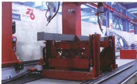
Bild 2. Steel Beam Assembler Compact bei der Arbeit