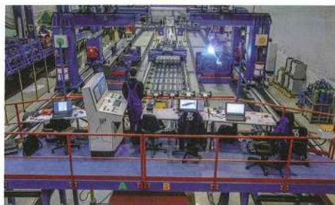
Bild 3. Steel Beam Assembler 2 Conti doppelseitig