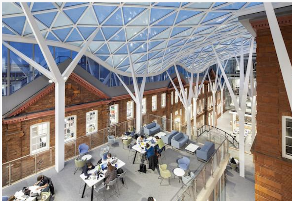
Heartspace an der Sheffield Universität by Zeman

um Projekt gemeinsam erfolgreich abgeschlossen haben, um voneinander zu lernen. Das war und ist mir bei allen Firmenzukäufen besonders wichtig.